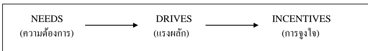
รูปที่ 2.1 ความสัมพันธ์ระหว่าง ความต้องการ แรงผลักดัน สิ่งจูงใจ

FRED LUTHANS (1995) ได้กล่าวว่า การจูงใจ หมายถึง กระบวนการที่เริ่มต้นจากการที่ร่างกายและจิตใจ มีความต้องการเกิดขึ้นแล้วมีแรงผลักดัน ทำให้เกิดแรงจูงใจ แล้วทำให้เกิดการกระทำ เพื่อนำไปสู่เป้าหมายตามที่ต้องการ ดังแสดงในภาพที่ 1